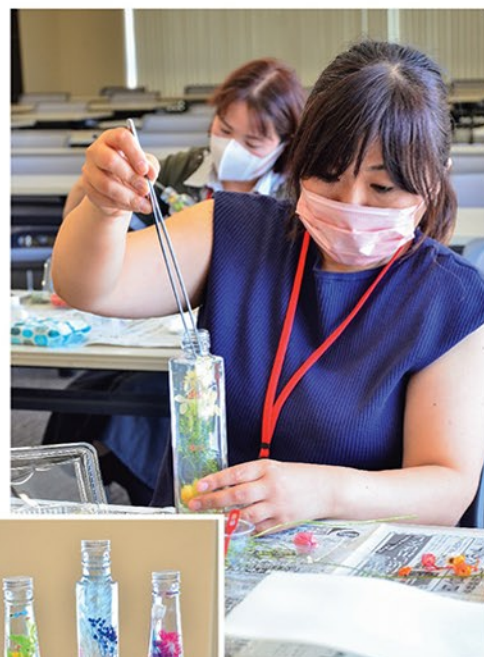
▲丁寧にハーバリウムの制作を行う受講生