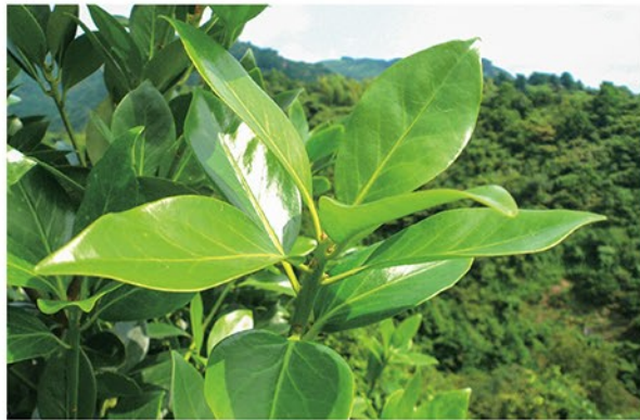
シキミは、葉や枝の独特の香りが特徴で抹香や線香の原料としても使用される