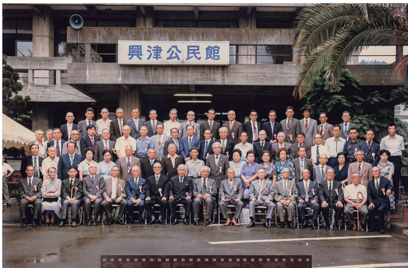
旧清水市合併20周年を祝った興津地区 昭和56年6月28日