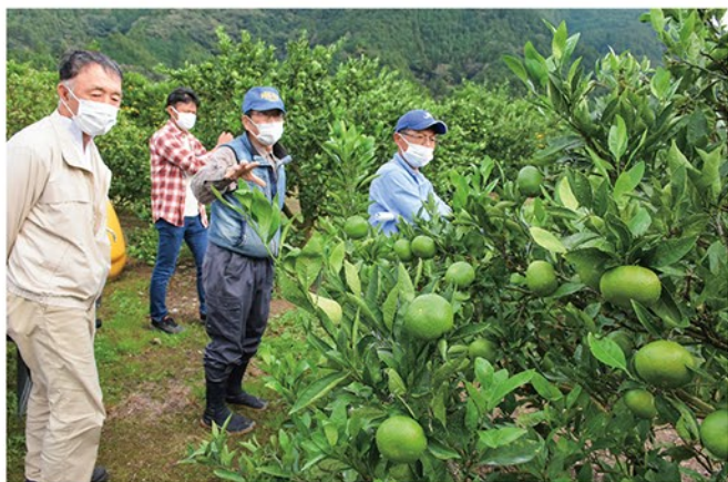
▲ 青島温州の収穫を控えた園地の状況を確認した委員たち

本年産は裏年傾向ではあるものの、生育は順調。委員たちは「例年より酸が低く、天候が順調に推移すれば、糖度も上がり高価格が期待できる」と話し合っていました。