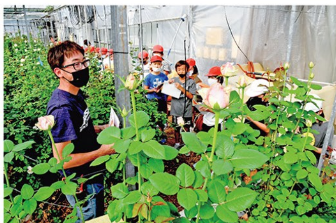
▲バラのハウスを見学した児童たち

同校ではバラの他、トマトや茶など地域の農産物について学んでいて、JA庵原支店や営農担当職員、青壮年部庵原支部が協力しています。