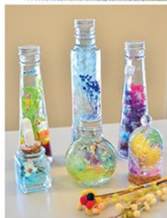
◀完成したハーバリウム