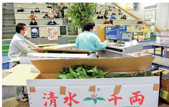
するが花き卸売市場で年に一度開かれる千両市。競り人の威勢のいい掛け声のもと、次々と競り落とされる。

各市場によって千両市の日には異なりますが、例年12月中旬に開かれます。松市の約1週間後に、千両市が開催され、1年に一度の特別な行事とされています。競りが始まる前に、本年産の入荷状況等を市場の担当者が買参人に伝え、その後競りが始まります。