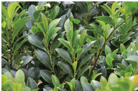
サカキの代用として神事に使われるヒサカキは葉の縁に浅いギザギザがある