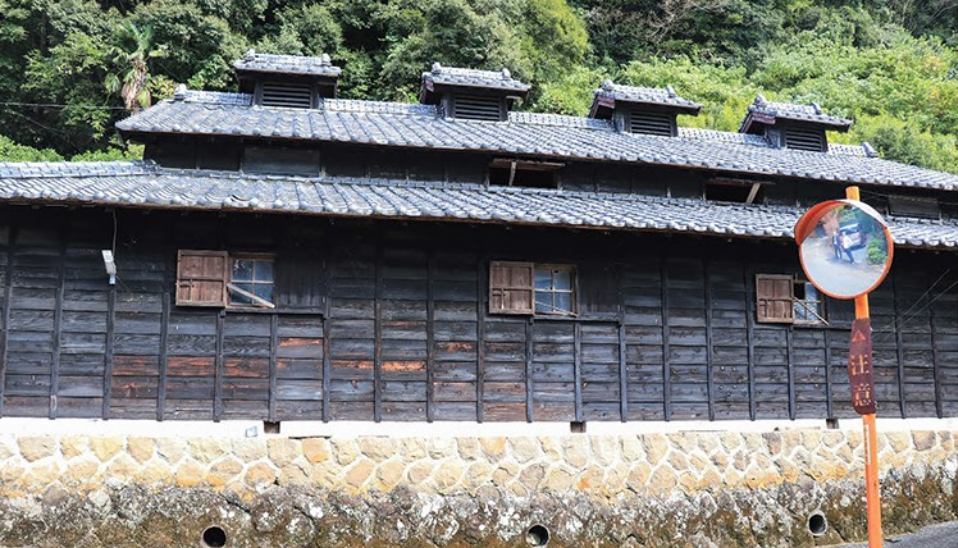
昭和5年に建てられたミカンの貯蔵庫。屋根の上と石垣の下に通気口が見える。

機械化と人材活用を積極的に進め、「基盤整備で農地が平らになり農業機械を入れやすくなったし、ケガや事故の心配も減ったので、今後もさまざまな人たちと農業を通じ交流を深めたい。いろんな人たちに出会えるのは楽しいからね」と笑顔で話してくれた。