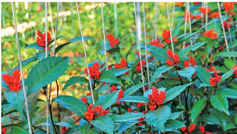
年に一度の千両市と出荷最盛期に向け収穫を待つ千両の園地

当JA管内では、約40年前から千両の栽培が始まりました。比較的価格が安定しており、消費者のニーズもあることから原・草ヶ谷地区の生産者約10人が取り入れたのがきっかけです。現在は吉原地区で栽培が盛