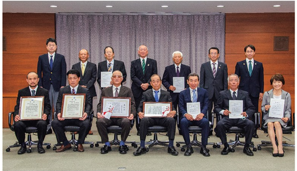
▲ 授与式に出席した生産者の皆さん