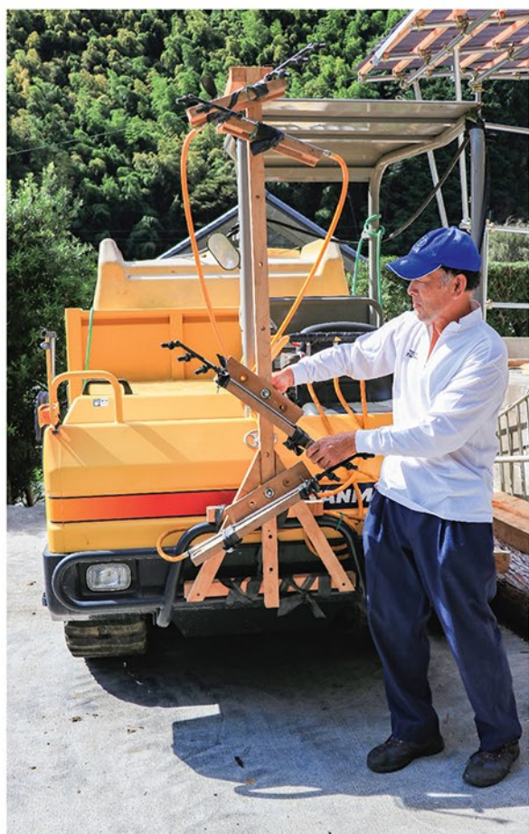
農作業用に改良した車両。前面にはスプレーノズル、荷台には薬剤タンクを取り付けてある。