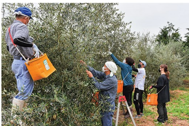
▲オリーブの収穫を楽しむ庵原支店職員

支店職員は「収穫は楽しかった。オリーブオイルで地域の輪を広げたい」と話していました。