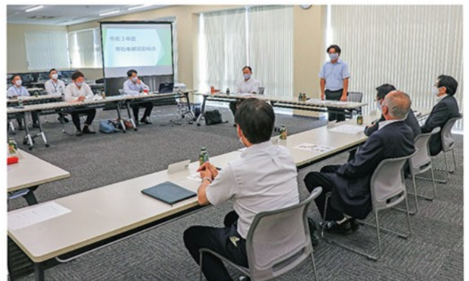
▲ 活発な意見が飛び交った青壮年部と常勤役員との意見交換会