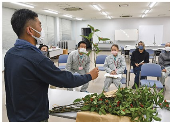
目ぞろえ会には市場担当者を招き、房数や実の付き方を一枝ずつ確認している。

日本では昔から庭木として栽培され、主に生け花などの鑑賞用として利用されてきました。松や葉牡丹などと合わせて赤や黄色の実を楽しみます。国内ではすでに江戸時代初期から